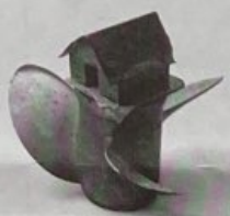
KCHO-Alexis Leyva Machado. Archipielago, 2003, propele, casa de madera y techo de metal. Edition 8, bronze, bronce, 10 1/2 x 11 3/4 x 12 1/2 in. / 27 x 30 x 32 cm. Juan Ruiz Galería

El convertirse en coleccionista de arte, marchand, curador o simplemente espectador no implica solamente seguir las propias obsesiones personales sino también tomar parte en la producción de bienes simbólicos, definiciones y registros en el mundo del arte. El reciente boom de las ferias de arte permite mostrar al arte en distintos contextos y aumenta las posibilidades de un diálogo más inmediato y directo entre el público general, el especializado y los artistas.