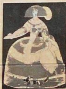
Las Meninas de Manolo Valdés se exponen en la Galería Estiarte.