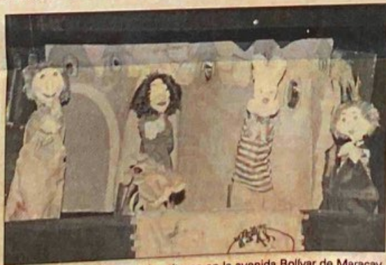
Nos esperan los títeres en la avenida Bolívar de Maracay.

toria, debemos recordar que el "Títere" como tal, para muchos tiene un origen incierto. Probablemente proviene de la voz imitativa del sonido "titi". El títere está conformado por figurillas de