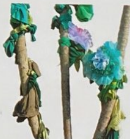
Guerra De La Paz