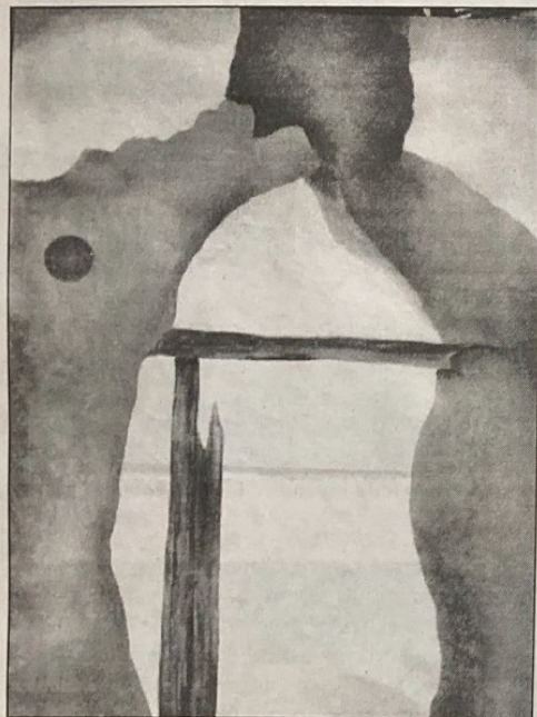
Detalle de una Ruina