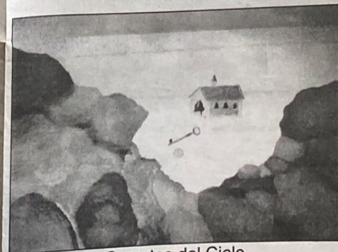
Secretos del Cielo