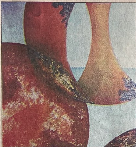
Abriéndonos al espíritu (1989). Técnica mixta

Cuando Riquezes habla del mensaje transmitido en sus pinturas, aflora su visión sobre la trascendencia de la vida humana: "En este momento tan importante de la historia, en vísperas de la llegada del tercer milenio, es indispensable resaltar la necesidad de crecimiento espiritual que tiene el