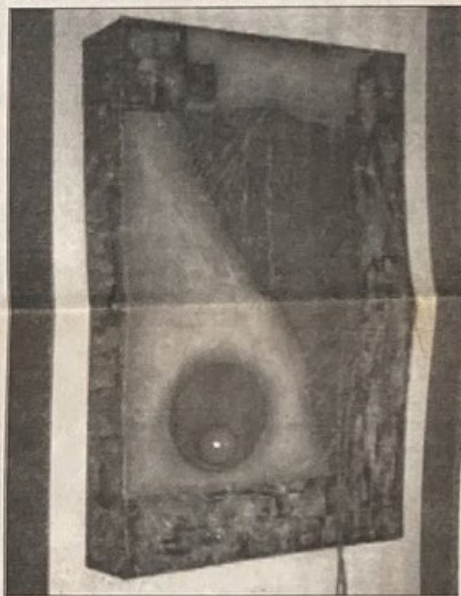
Una se las pinturas tridimensionales de Sylvia Riquezes

Sylvia Riquezes: "no creo que el arte sea algo estático"